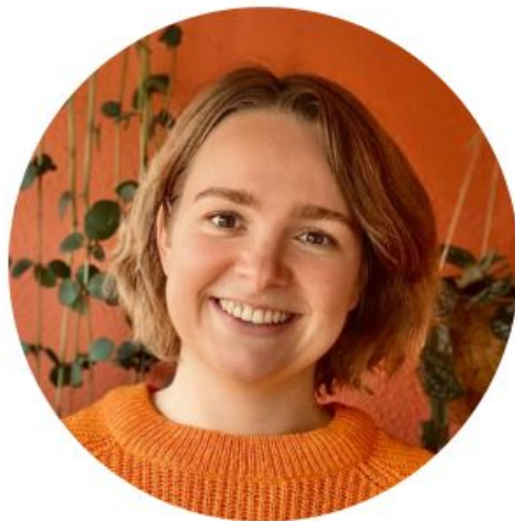
Wies Oudshoorn Circulariteit en Groen

Elk stadsdeel heeft een eigen duurzaamheids- coördinator, wij zijn er voor stadsdeel Noord